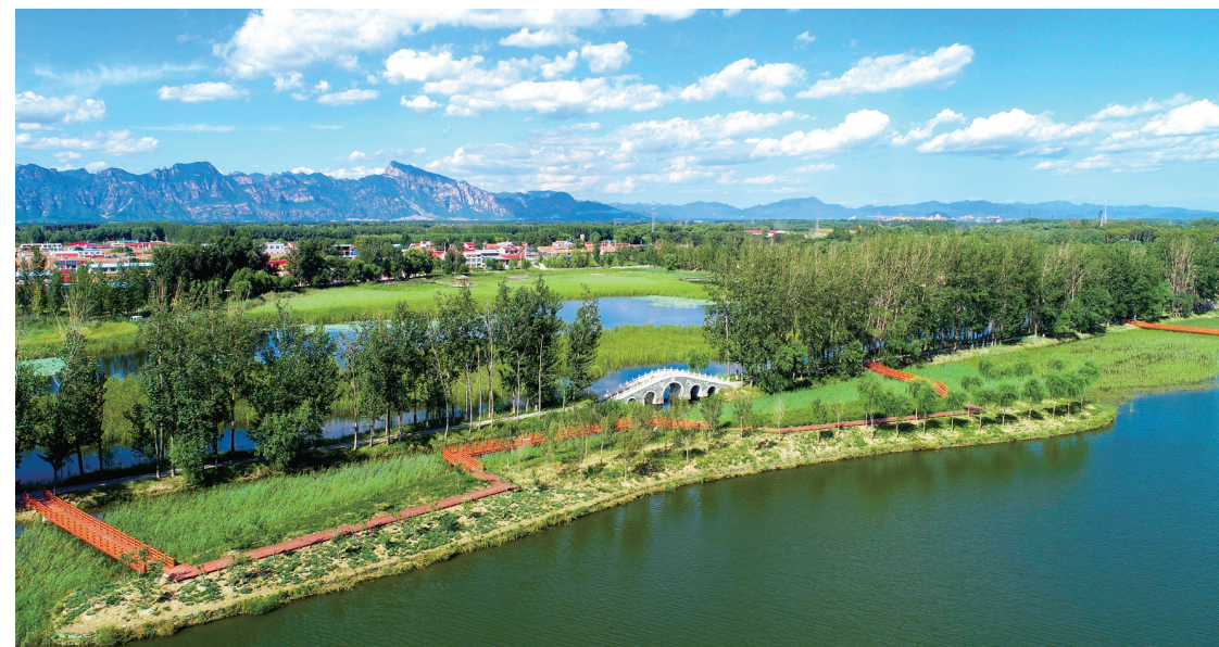
碧水悠悠的妫河世园段生态岛

项执法行动,树立起水法执法权威。在2019年的普法宣传中,共发放、张贴宣传材料700余份,普法教育80余次,截至目前,行政执法共计124件,处罚金额73.0684万元。