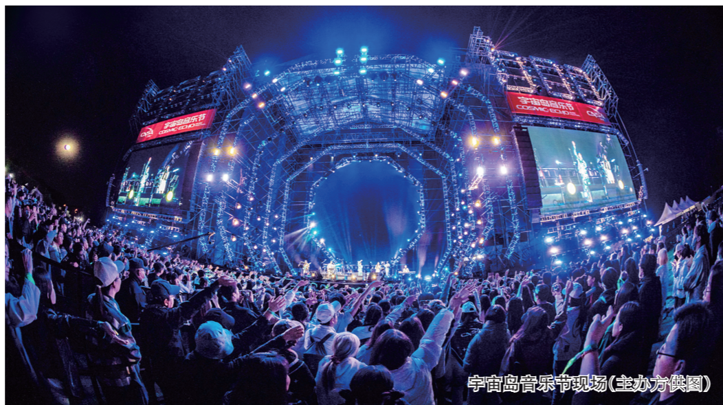
宇宙岛音乐节现场

200余位社区居民共同度过了一段愉快的时光。香水园街道、儒林街道市民活动中心均组织开展了花灯手工制作活动,丰富居民精神文化生活,营造浓厚的节日氛围。