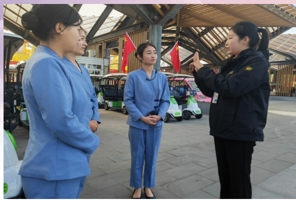
部署工作

万家团聚、举国欢庆之时,一个个朴实无华的身影却坚守在自己的工作岗位上,在一如既往的奔波忙碌中,在扎实高效的贴心服务中,用执着坚守诠释家国情怀,用默默奉献服务保障假期里的游客。