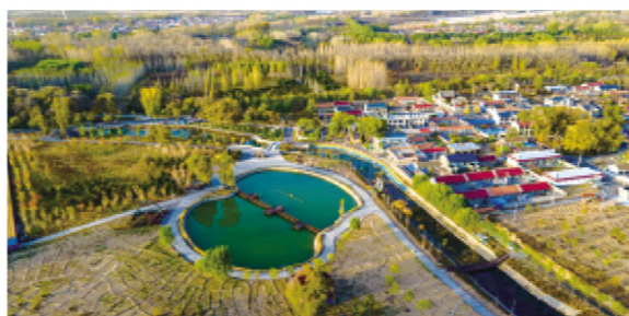
美丽乡村整洁靓丽

“山美，水美，人更美！”是延庆“美丽乡村”建设过程中的不断追求，为提高乡村社会文明程度，延庆区聚焦学习贯彻习近平新时代中国特色社会主义思想，推进农村思想政治工作，广泛开展“听党话、感党恩、跟党走”宣讲活动，全方位宣传展现全区农业农村发展和脱贫攻坚取得的历史性成就，发生的历史性变化，坚定主心骨、汇聚正能量、振奋精气神。同时，延庆区依托新时代文明实践中心建设，推出“点单派单”数字化服务平台，统一各项服务机制，整合46个部门资源，组建8支“延庆乡亲”专业志愿服务队伍，实现了“村民点单，中心派单，志愿接单”，农村公共服务不“落单”，率先在全国走出了一条乡村宜居宜业的现代化新道路。