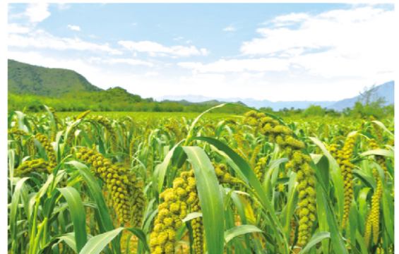
“希望田野”喜获丰收

2003年10月，几个不起眼的火盆打开了井庄镇柳沟村“火盆锅—豆腐宴”的产业发展之路。截至2022年底，柳沟村累计旅游接待人次已突破1000万，收入突破5亿元，每年带动村集体增收超百万元，带动周边千余名村民就业，推动柳沟村全村村民人均收入由2003年的不足3千元增长至2.7万元，成为京郊远近闻名的民俗旅游村。如今，柳沟村的“火盆锅—豆腐宴”依然受到市民游客喜爱，村内新增了不少精品民宿，为游客休闲度假提供更多选择。