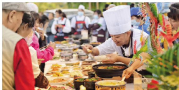
乡村旅游持续提升