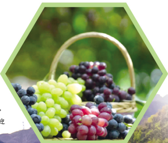
“妫水农耕”品牌深受欢迎

在延庆人的不懈努力下，不仅守护好了可贵的“绿水青山”，更迎来了推动乡村振兴、农民增收的“金山银山”，精心呵护的“美丽花园”，不仅成为延庆区自身发展的重要需求，更为首都筑起一道坚实的生态屏障，也为延庆农业发展提供了极佳的条件。