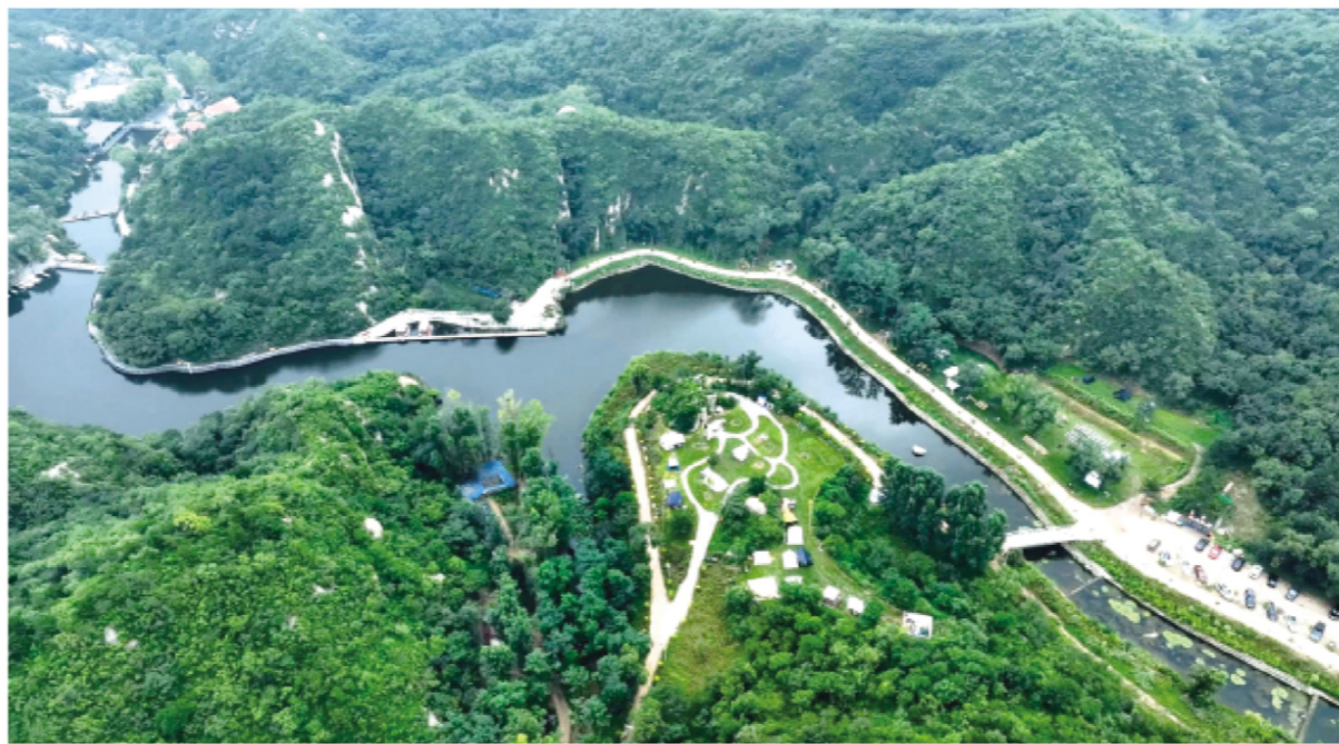
“九沟十八湾”风景如画

“产业兴旺，环境友好”是延庆在推进农业产业发展过程中的根本遵循。近年来，延庆区通过制定乡村生态振兴年度重点任务清单，推动农业、农村绿色发展，有效保护和合理开发农业资源，提高资源质量。推广环境友好型种养品种和模式，采用节水、节地、节能技术和农业废弃物资源化利用模式，提高资源利用率和产出率。以农村土壤污染、水污染防治为重点，持续推进农业化学投入品减量和替代，持续开展有机肥补贴项目，提高农业生产清洁化程度和农业环境的自我修复能力。持续不断的改良和优化，让全区耕地全部成为优先保护类耕地，无受污染耕地。